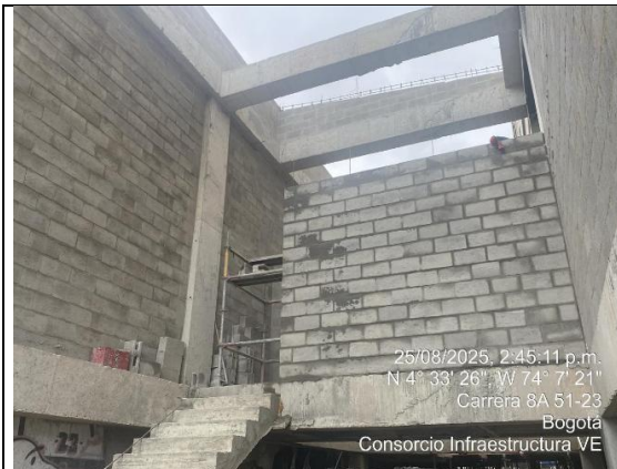
Instalación de muros 18/07/2025