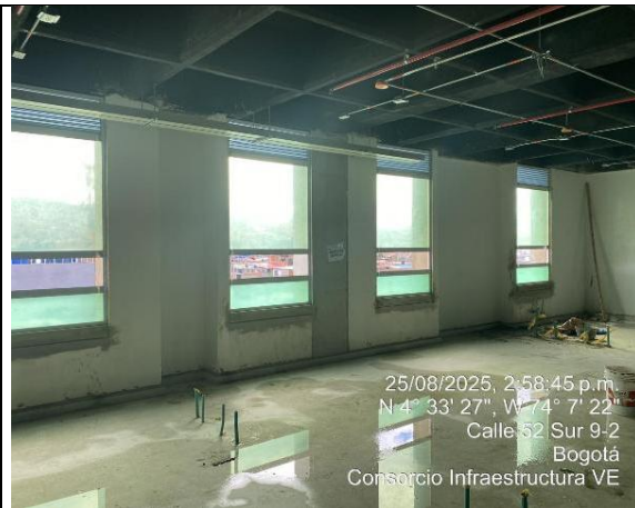
Instalación de Ventanas 25/08/2025