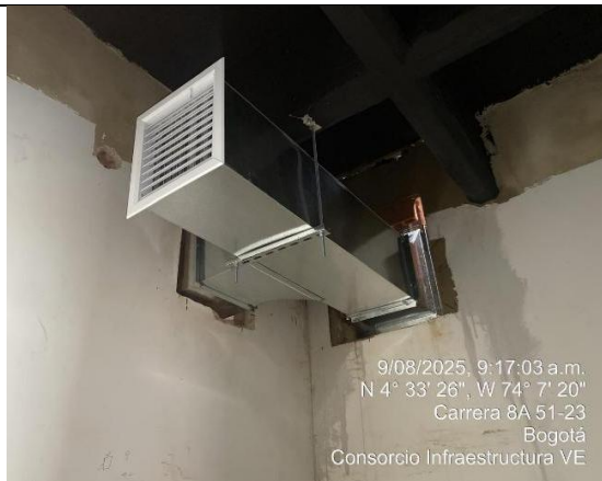
Instalación ductos de aire 9/08/2025