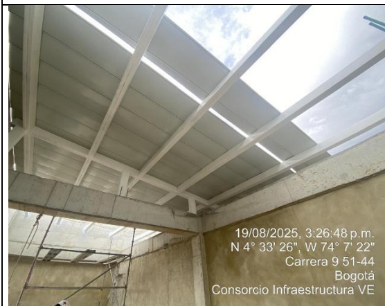
Instalación Tejas 19/08/2025