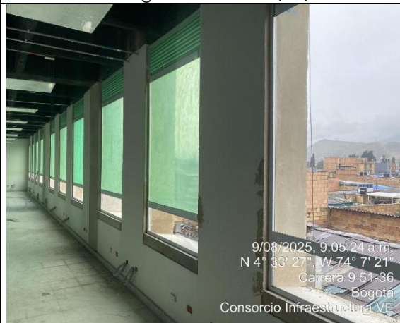
Instalación de Ventanas 09/08/2025