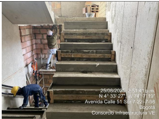
Instalación de piso escalera 25/08/2025