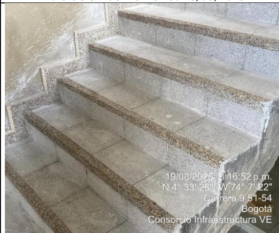
Instalación baldosa en escalera 19/08/2025