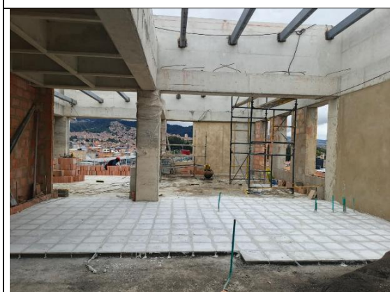
Instalación de piso 4 piso 31/07/2025