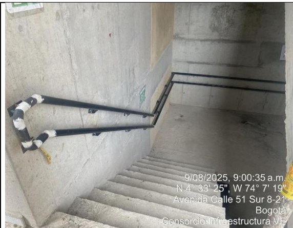
Instalación de barandas escaleras 9/08/2025