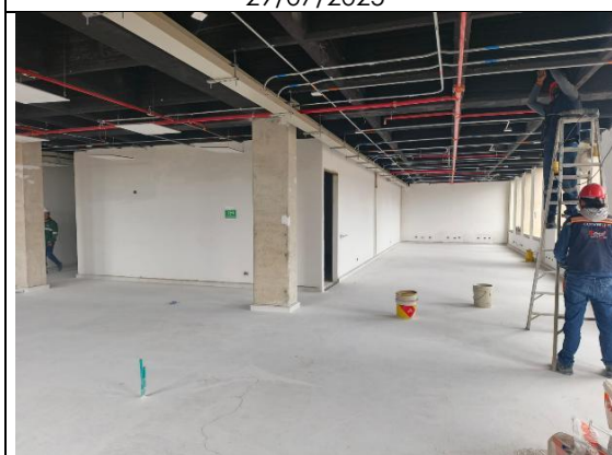
Instalación de Pisos 30/07/2025