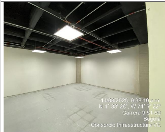
Estuco y Pintura 14/08/2025