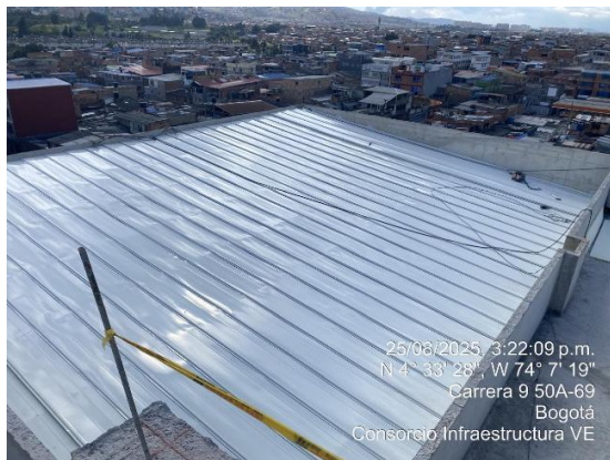
Instalación de Techo 25/08/2025