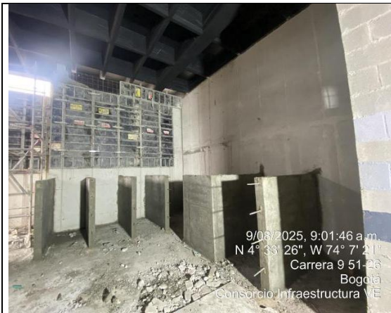
Fundida de muros salas de paso 09/08/2025