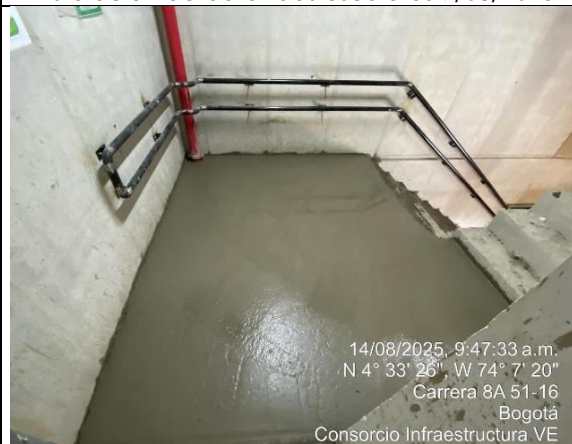
Fundida piso escaleras 14/08/2025