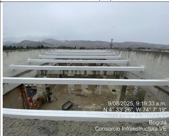
Pintura Vigas Metalicas 09/08/2025