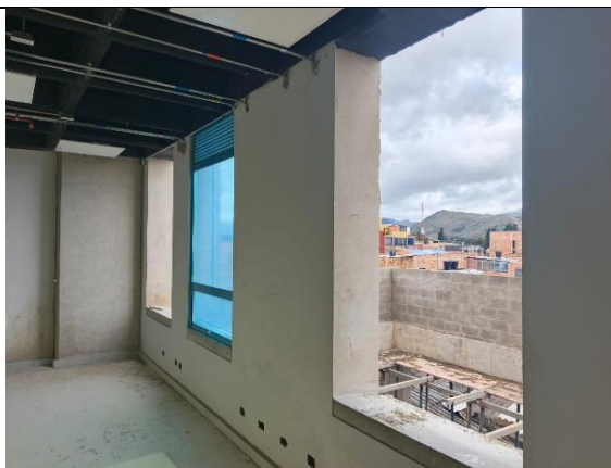
Instalación de ventanas 29/07/2025