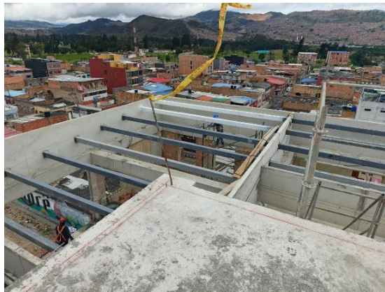
Instalación de vigas de cubierta 01/08/2025