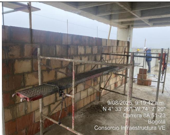
Instalación de mampostería 9/08/2025