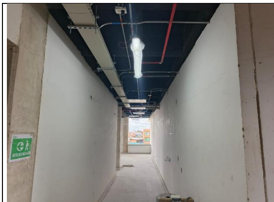
Pañete y Pintura 29/07/2025